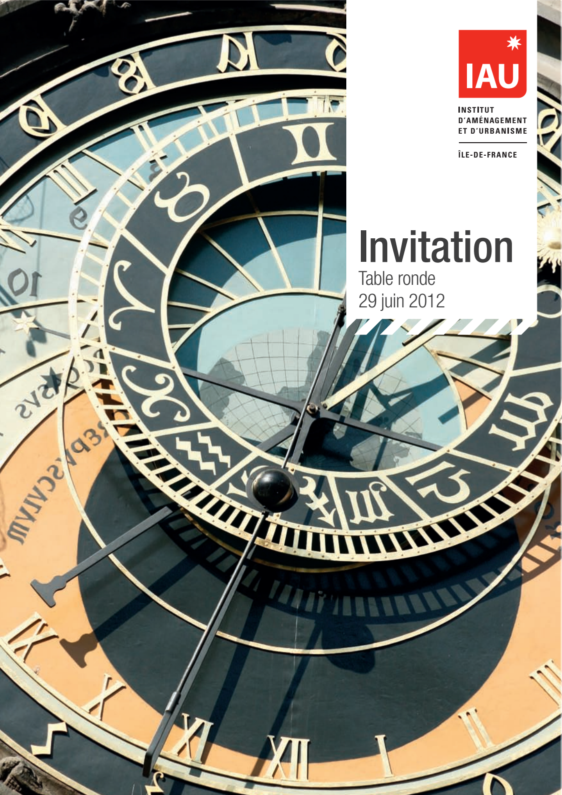
Table ronde 29 juin 2012